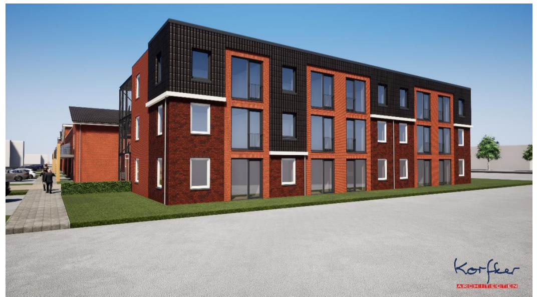
Boven: impressie 15 compacte appartementen

Samen met architect Korfker heeft Patrimonium gezocht naar een ontwerp dat functioneel, duurzaam en gebruiksvriendelijk is. Bouwbedrijf Materboer is gestart met de bouw en de oplevering wordt verwacht in september 2021.