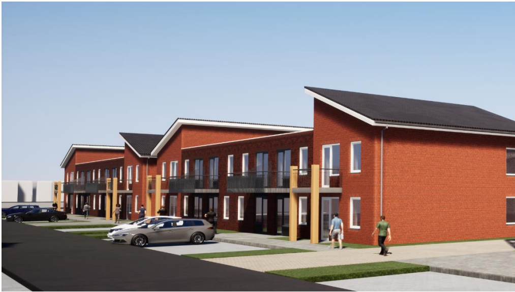
Boven: impressie 24 appartementen

Onlangs is Patrimonium gestart met de bouw van 39 appartementen voor 1 en 2 persoonshuishoudens aan de Constantijnstraat. 24 van deze appartementen worden levensloopbestendig gebouwd. Dat betekent dat deze appartementen ook geschikt zijn voor senioren. 15 appartementen zijn compacte tweekamerappartementen, die zeer geschikt zijn voor éénpersoonshuishoudens.